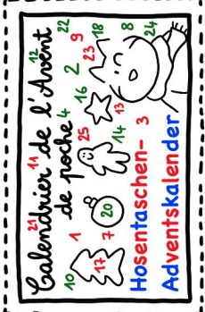
Image de couverture Titelbild

à coller sur la dernière image auf das letzte Bild kleben